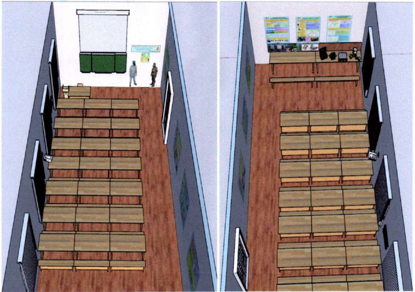
Фронтальний вид навчального класу