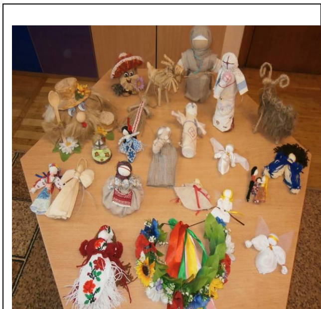
Фото (виставки, заняття, свята)